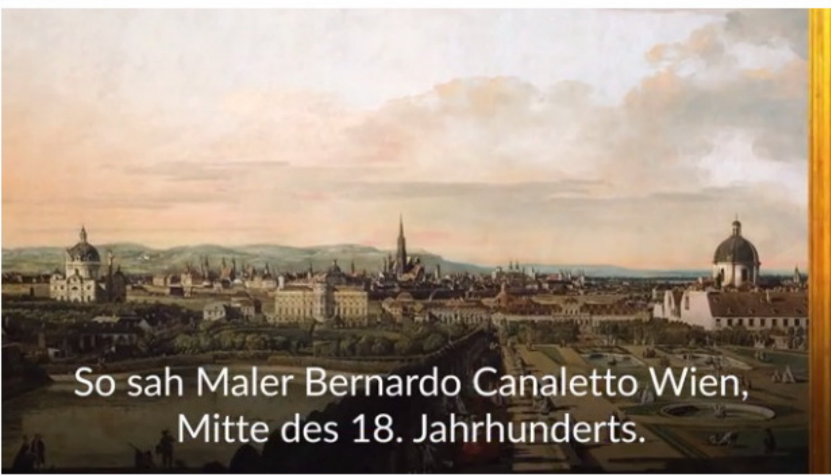
So sah Maler Bernardo Canaletto Wien, Mitte des 18. Jahrhunderts.