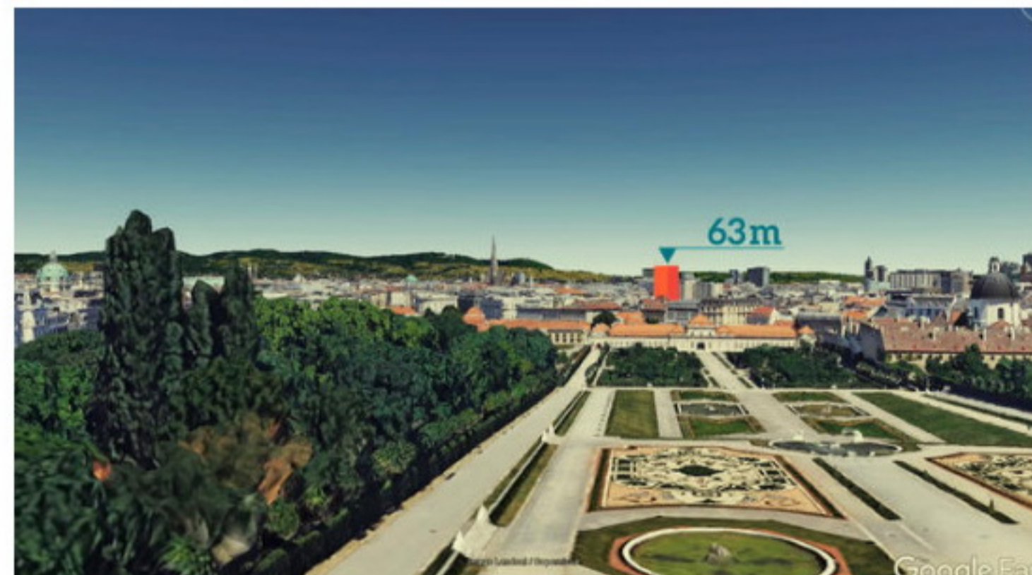
© Dossier Zu hoch: Maximal 43 Meter dürften es eigentlich nur sein

Mehrere Bürgerinitiativen haben sich daher zusammenschlossen, um gemeinsam gegen das Hochhaus-Projekt am Heumarkt vorzugehen. Bei einer Pressekonferenz am Freitag unterzeichneten die Vertreter von elf Organisationen ein Memorandum, in dem sie an die verantwortlichen Politiker appellieren, alle erforderlichen Maßnahmen gegen die drohende Aberkennung des Welterbestatus der Wiener Innenstadt zu setzen.